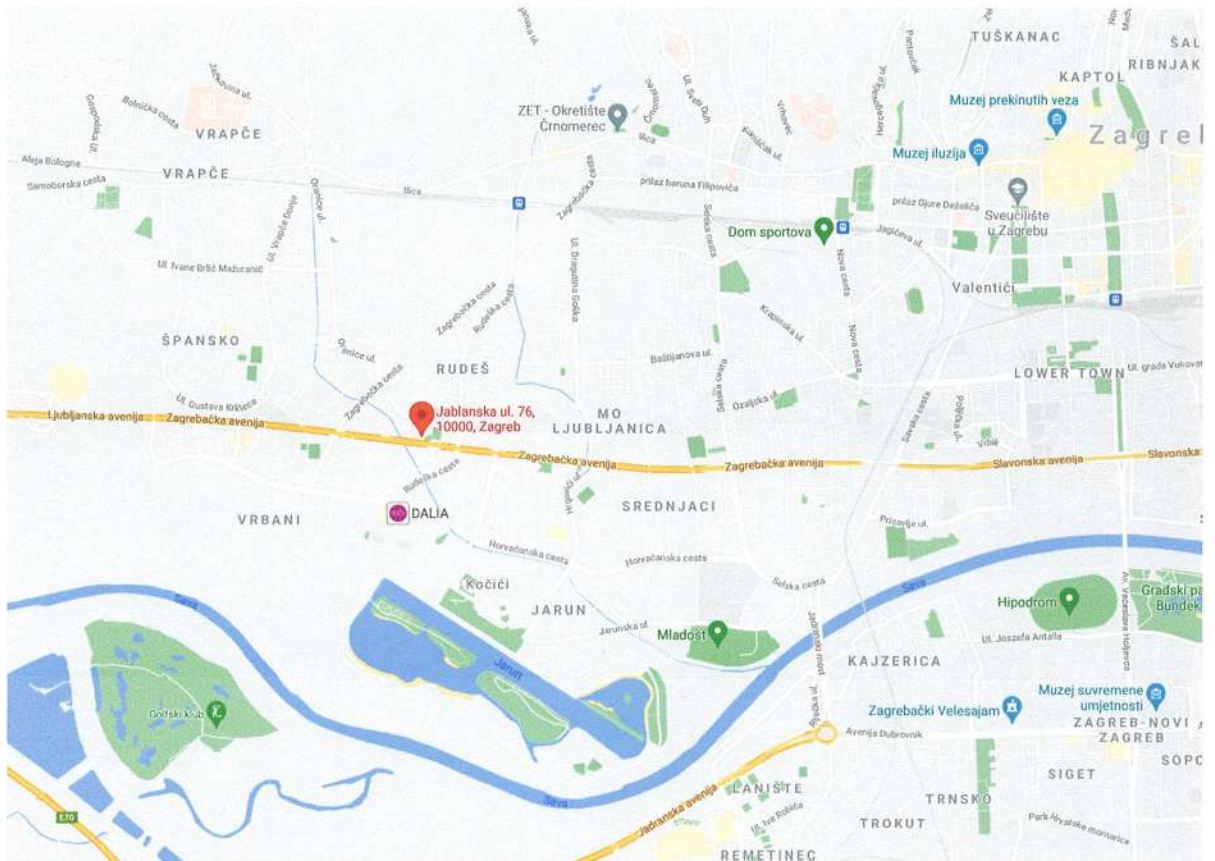
Makrolokacija, izvor: https://www.google.hr/maps/